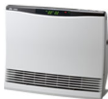
【温水ルームヒーター】