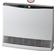
温水ルームヒーター