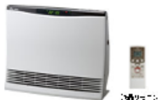
【温水ルームヒーター】