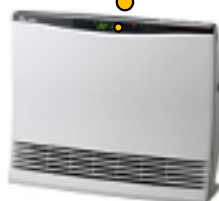
温水ルームヒーター