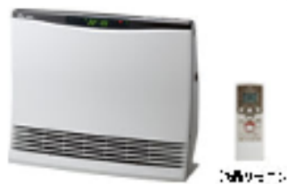
【温水ルームヒーター】