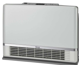
温水ルームヒーター