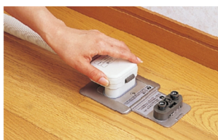
温水コンセント(床)